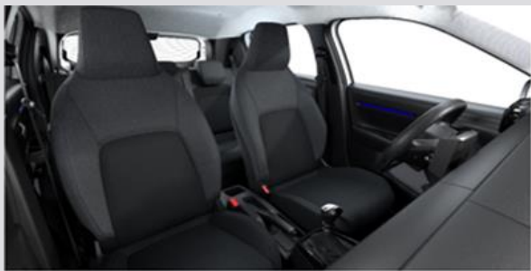
NAFX: Tapiterie textila Grey (gri / negru)