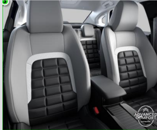
DTAB: Tapiterie mixta Metropolitan Grey (TEP/textil bi-ton negru/gri deschis)