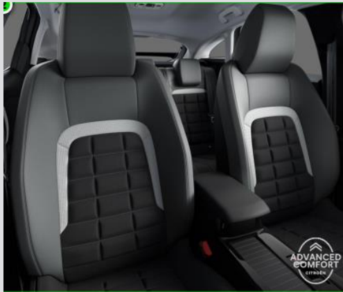
DQAB: Tapiterie mixta Urban Grey (textil/TEP bi-ton gri/negru)