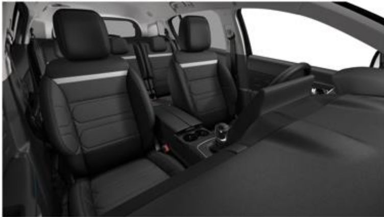
Tapiterie mixta Metropolitan Black (XCAB)