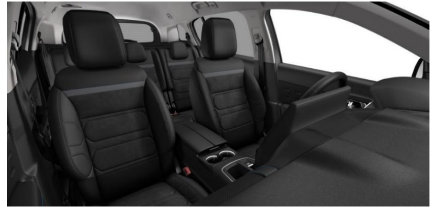
Tapiterie mixta Urban Black (0JFD)