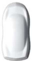
Kaolin White solid