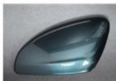
NEW Libeccio Blue