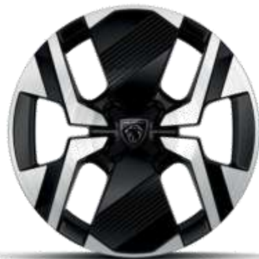
Jante diamantate bi-ton KARAKOY din aliaj de 17"

Standard pe nivelele de echipare ALLURE și GT