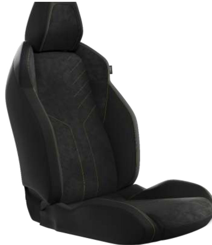
Tapîțerie Mistral "ICONIUM" Alcantara® cu tapîțerie TEP "Isabella" și cusături de culoare verde