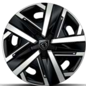
Jante de oțel SILOM de 16"