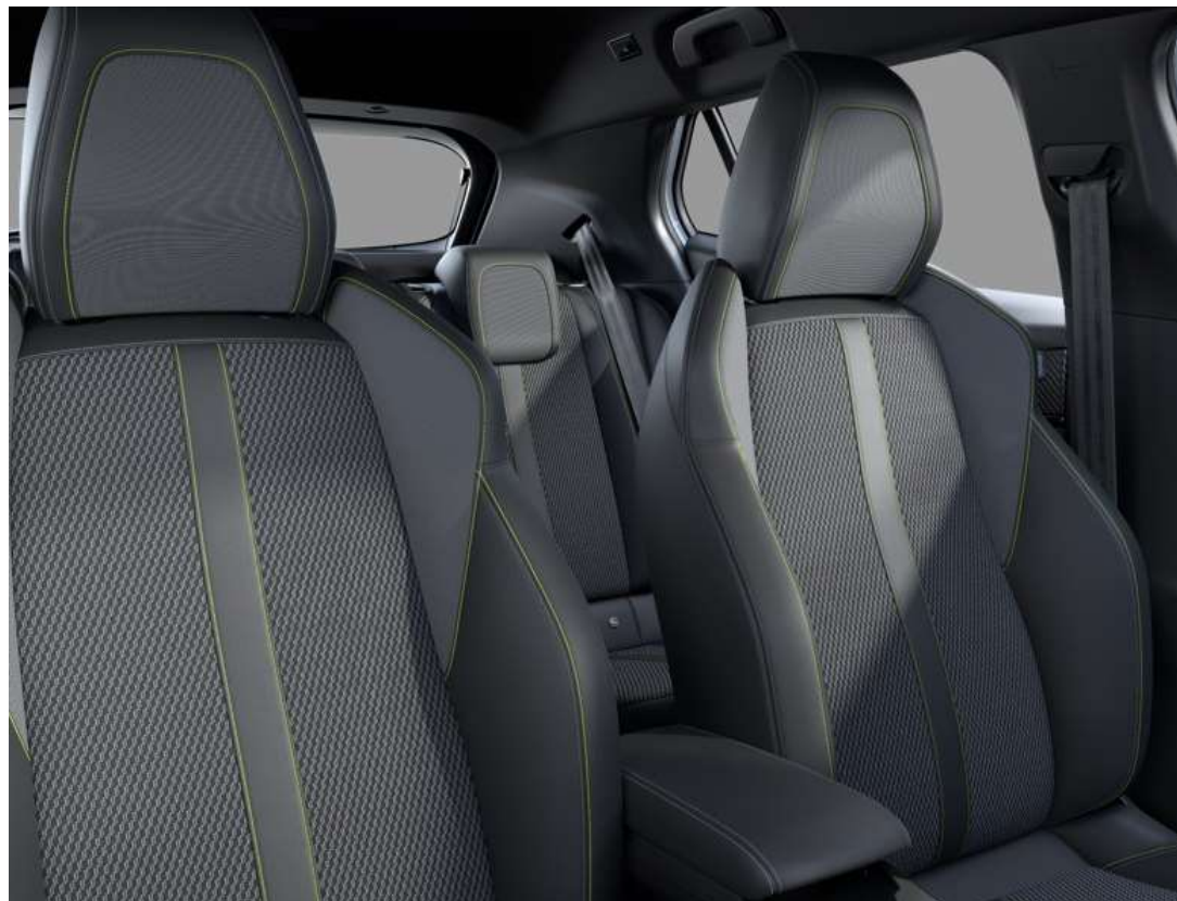
Tapîțerie din țesătură "BELOMKA", cu TEP "Isabella" și cusături de culoare verde