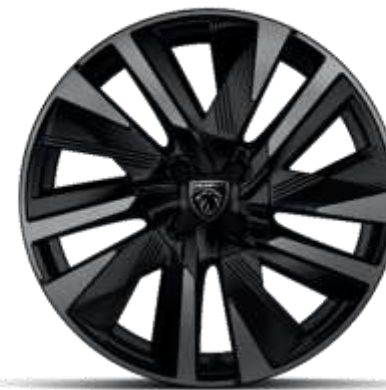
Jante diamantate bi-ton EVISSA din aliaj de 18"

Standard pe nivelele de echipare ALLURE și GT