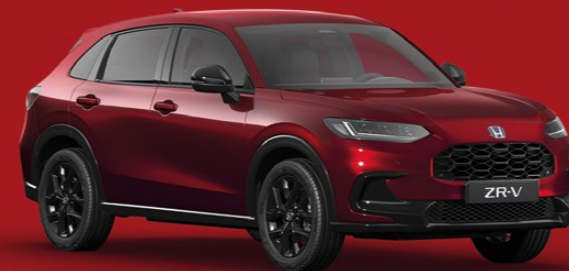
RADIANT RED METALLIC