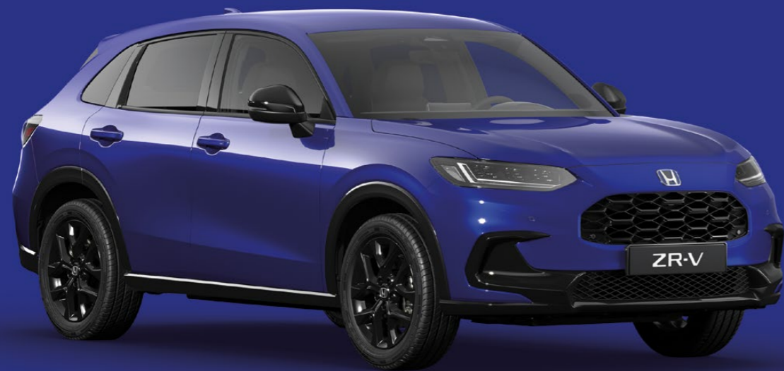
STILL NIGHT PEARL

Alege dintr-o gamă de culori contemporane care reflectă personalitatea ta și stilul dinamic al modelului ZR-V.