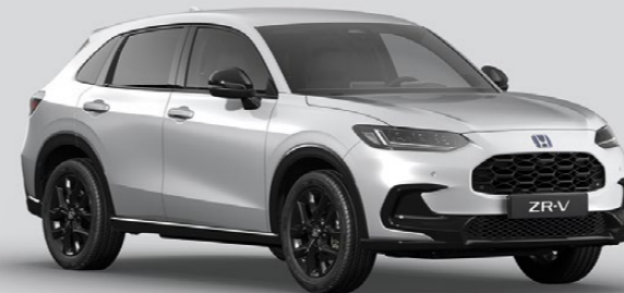
DIAMOND DUST PEARL