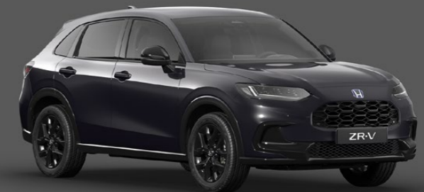
RUSE BLACK METALLIC

Modelul din imagine este Honda ZR-V e:HEV, echiparea Sport. Pentru mai multe informații asupra disponibilității acestor dotări, precum și a altora, te rugăm să consulți paginile de specificații 56-61.