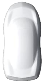
Alb 'Blanc Icy' (Standard)