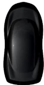
Negru 'Perla Nera' metallic