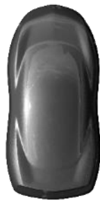
Gri 'Titanium' metallic