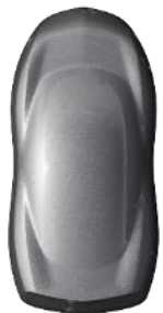
Gri Artense metallic