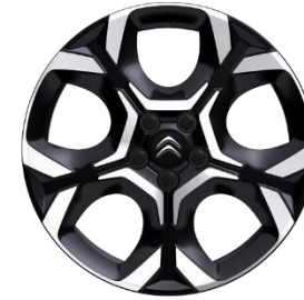
Jante aliaj diamantate 18" PULSAR (225/55 R18) (ZHXI)