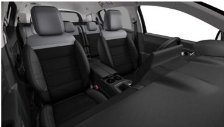
Tapiterie mixtă Metropolitan Grey (FNFA)