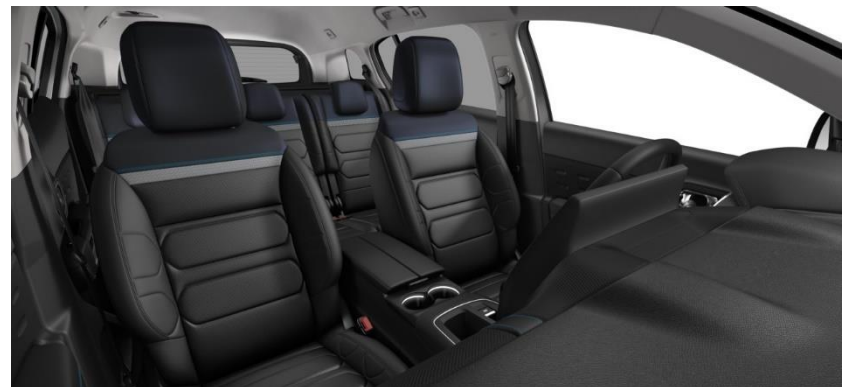
Tapiterie piele Hype Black (U0FO)