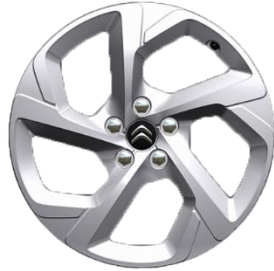
Jante aliaj 18" SWIRL (Gris Eclat Brillant) (225/55 R18) (ZHC7)