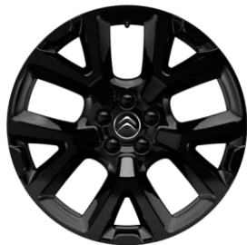
Jante aliaj Full Black 19" ART (Tall & Narrow) (205/55 R19) (ZHNY)