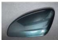
NEW Libeccio Blue