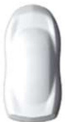
Kaolin White solid