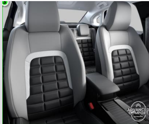
DTAB: Tapiterie mixta Metropolitan Grey (TEP/textil bi-ton negru/gri deschis)