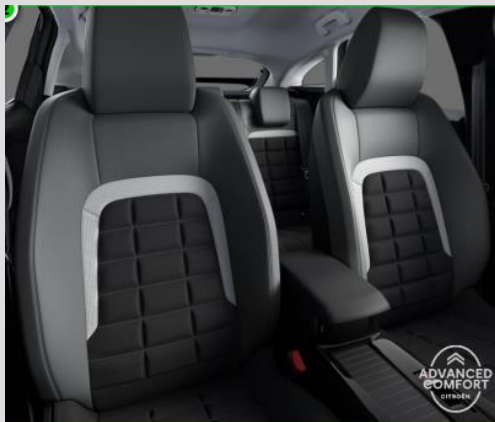
DQAB: Tapiterie mixta Urban Grey (textil/TEP bi-ton gri/negru)