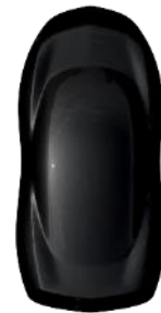
Negru Perla Nera