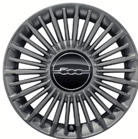
4AY – Jante din aliaj R16 (optional AFQ - Pachet Style)