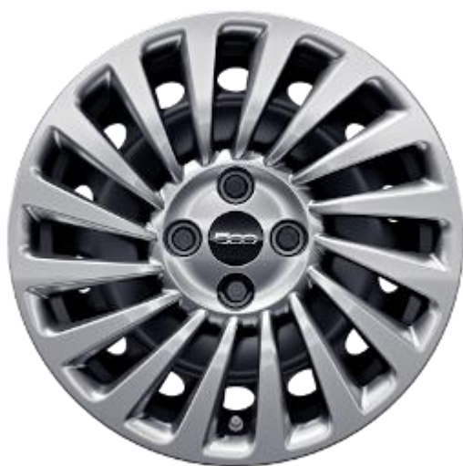
431 – Jante din otel R15 (standard Hatchback, Cabrio, 3+1)