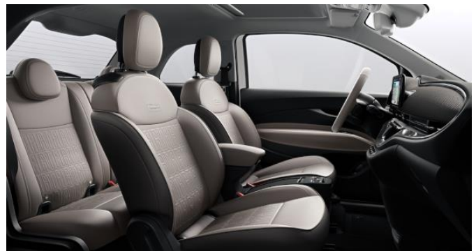
Standard La Prima by Bocelli Hatchback & 3+1: 845 Cabrio: 205