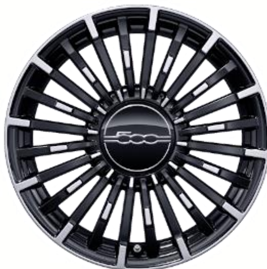
404 – Jante din aliaj R17 (standard La Prima By Bocelli )