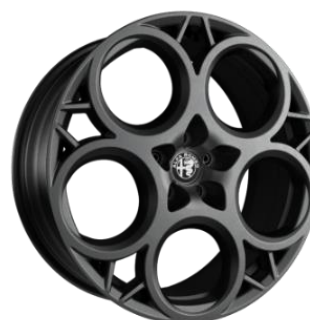
1M5 R20 standard Tributo optional Sprint si Veloce