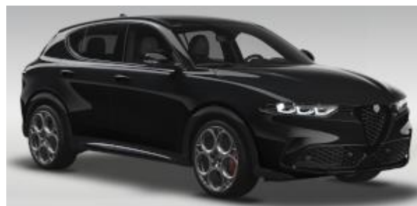
6FX (601) - Nero Alfa