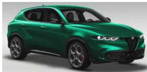
6FW (398/D) - Verde Montreal