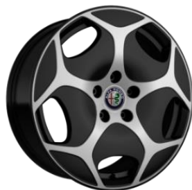
WAC R17 optional Sprint