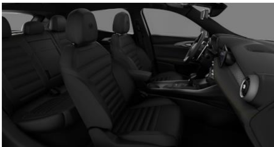
095 – Piele perforata de culoare neagra si cusatura bej (standard Veloce / optional Sprint B1F)