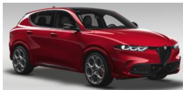
6Y2 (956/C) - Rosso Alfa cu plafon negru