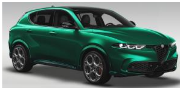
6Y3 (041/B) - Verde Montreal cu plafon negru