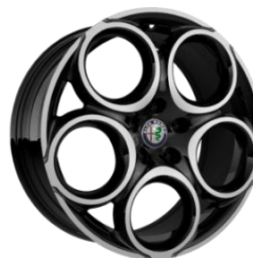
WBR R18 standard Sprint