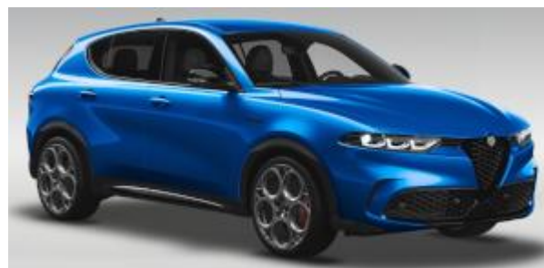
3YS (756/A) - Blu Misano