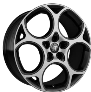
1MJ R19 standard Veloce optional Sprint