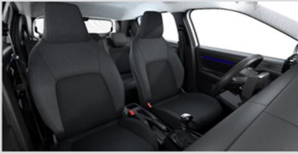
NAFX: Tapiterie textila Grey (gri / negru)