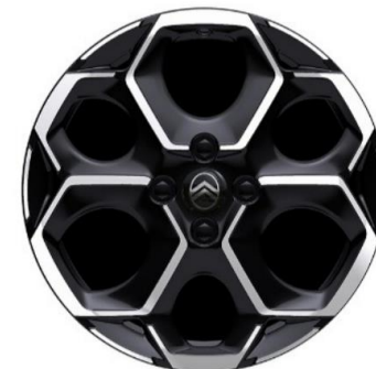
17" aliaj MAX