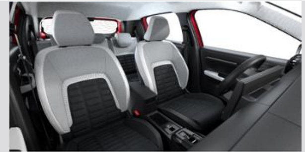
NHFX: Tapiterie textila TEP / textil bi-ton negru / gri cu banda gri