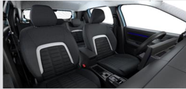
NBFX: Tapiterie textila (gri / negru) cu banda gri